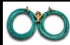
MANGUERA DE DISTRIBUCIÓN 3