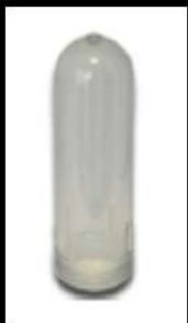
CARCASA PARA ELEMENTO FILTRANTE