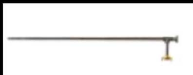
ADAPTADOR DE MEDICIÓN